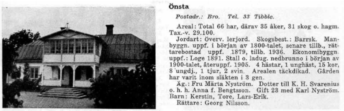
Från Svenska Gods och Gårdar 1938

Troligtvis blev Önssta kvar i familjens ägo då det efter deras flytt kommer arrendebönder. Mer forskning behövs.